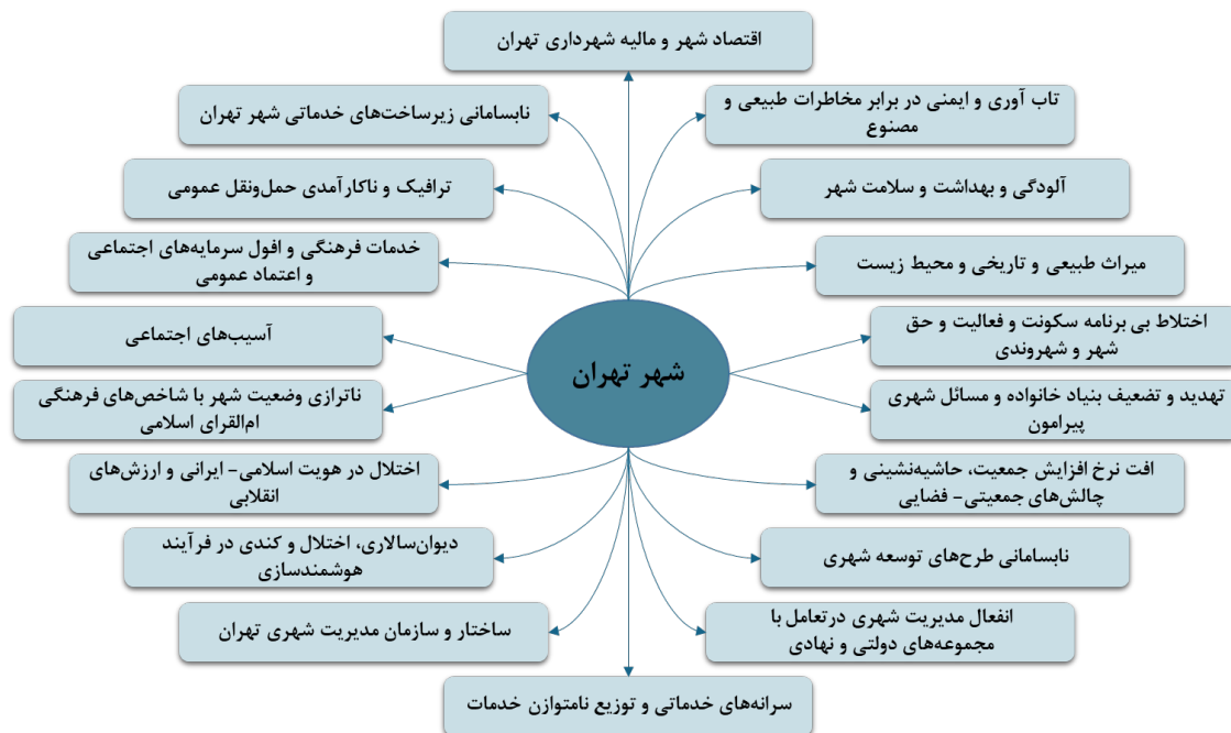
شکل ۲: اهم مسائل شهر تهران

به لحاظ ویژگی های طبیعی، تهران به دو بخش ناحیه دشتی و کوهپایه های البرز تقسیم می شود و اقلیم آن نیمه خشک است. از نظر تقسیمات سیاسی شامل سه شهرستان شمیران، تهران و ری است و به لحاظ تقسیمات اداری دارای ۲۲ منطقه، ۱۲۴ ناحیه و ۳۵۲ محله است. چنین ویژگی هایی، ظرفیت و پتانسیل های بسیاری را برای شهر تهران به عنوان مرکز جمعیتی، اقتصادی و سیاسی ایران مهیا ساخته است؛ اما مدیریت شهری تهران به رغم پتانسیل ها و ظرفیت های موجود؛ در وضعیت کنونی دچار مسائل و چالش های بسیاری است که اهم آن به شرح زیر قابل ارائه است.