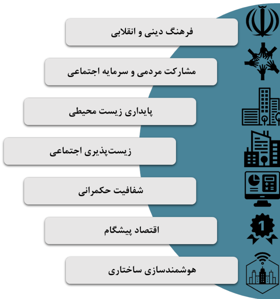
شکل ۳: اصول اساسی مدیریت شهری تهران

پس از شناخت مسائل بااهمیت (متناظر با اسناد توسعه شهری)، نقاط قوت، ضعف، فرصت و تهدید شهر تهران از یکسوی و اخذ نظرات کارشناسان و مدیران شهری از سوی دیگر؛ برنامه پیشنهادی مدیریت شهری تهران در چارچوب اصل‌های پایداری زیست‌محیطی، زیست‌پذیری اجتماعی، فرهنگ دینی و انقلابی، مشارکت مردمی و سرمایه اجتماعی، اقتصاد پیشگام، شفافیت حکمرانی، هوشمندسازی ساختاری ترسیم شده‌است.